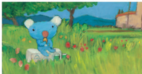
『おなかすいたね、ペネロペ』 Bon appétit Pénélope