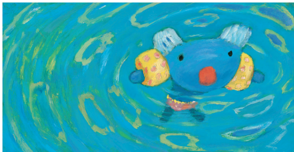
『ペネロペ うみへいく』 Pénélope à la plage