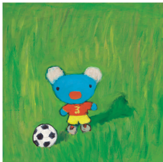
『ペネロペ スポーツをする』 Pénélope fait du sport