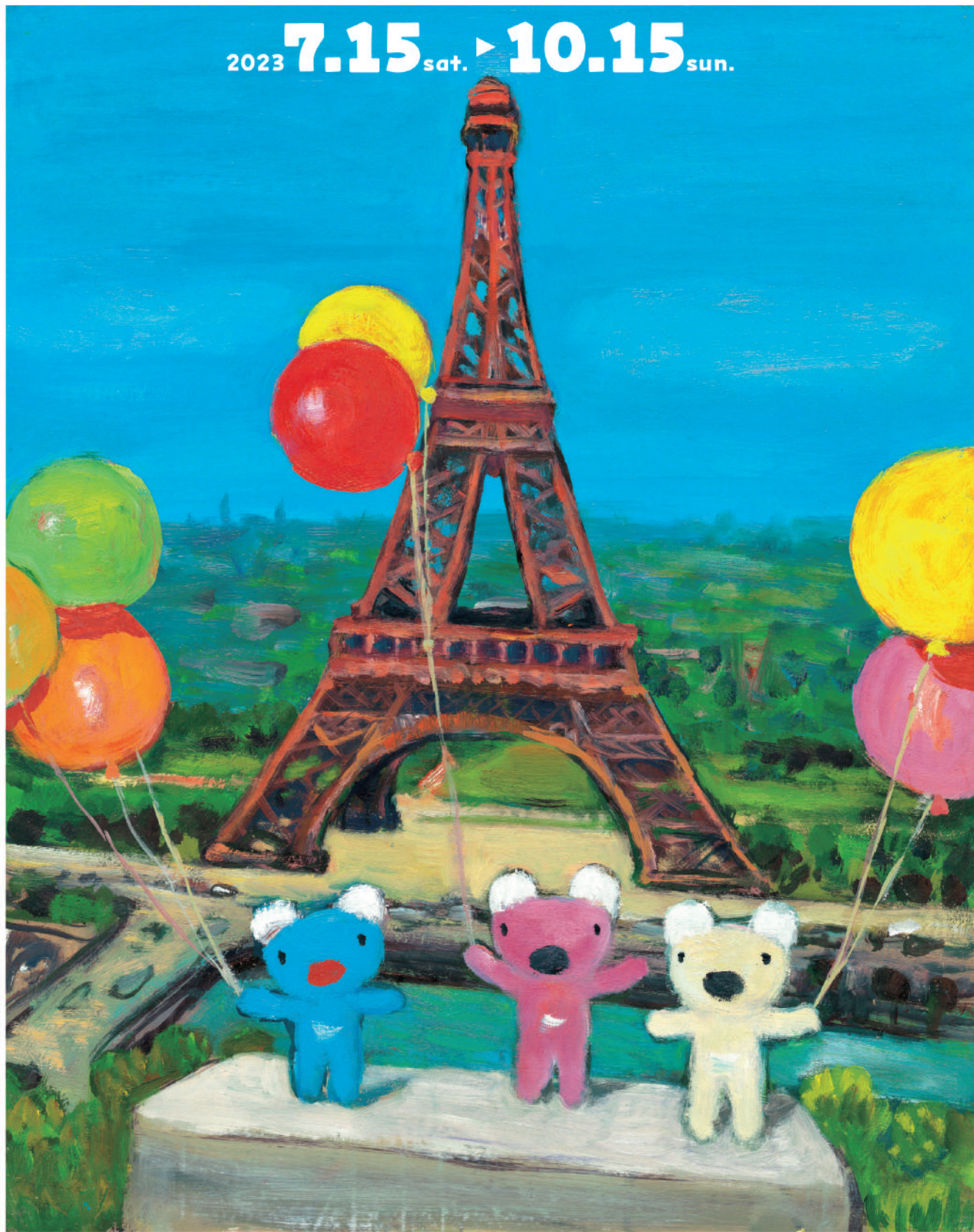
『ペネロペ パリへいく』より

観る・創る・学ぶ — 香りの夢空間 磐田市香りの博物館 The Museum of Fragrance, Iwata