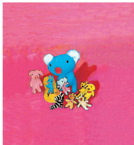
『ペネロペ かずをかぞえる』 Pénélope salt compter